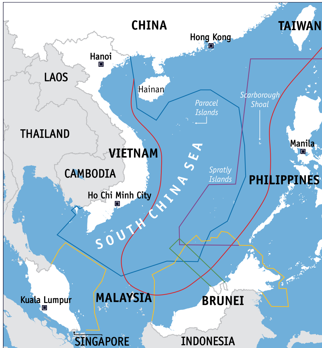
China and Taiwan Malaysia Vietnam Brunei Philippines

Ovanstående karta visar vilka öar, rev och kobbar som respektive land har anspråk på.