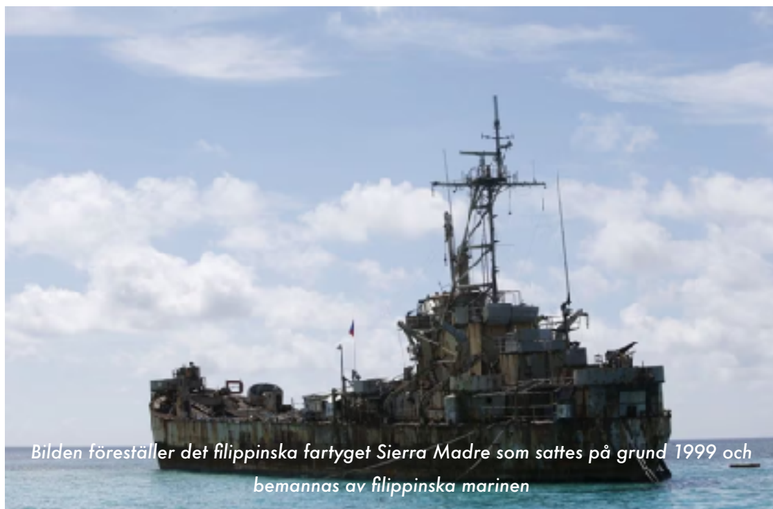
Bilden föreställer det filippinska fartyget Sierra Madre som sattes på grund 1999 och bemannas av filippinska marinen

Både Indien och Indonesien har också dragits in i konflikten. Indien därför att man har slutit en överenskommelse med Vietnam om att exploatera en del av vattnen i ögrupperna vilket strider mot Kinas önskan. Indonesien därför att man upprepade gånger har bordat andra länders fiskerfartyg i vad man kallar indonesiska farvatten.