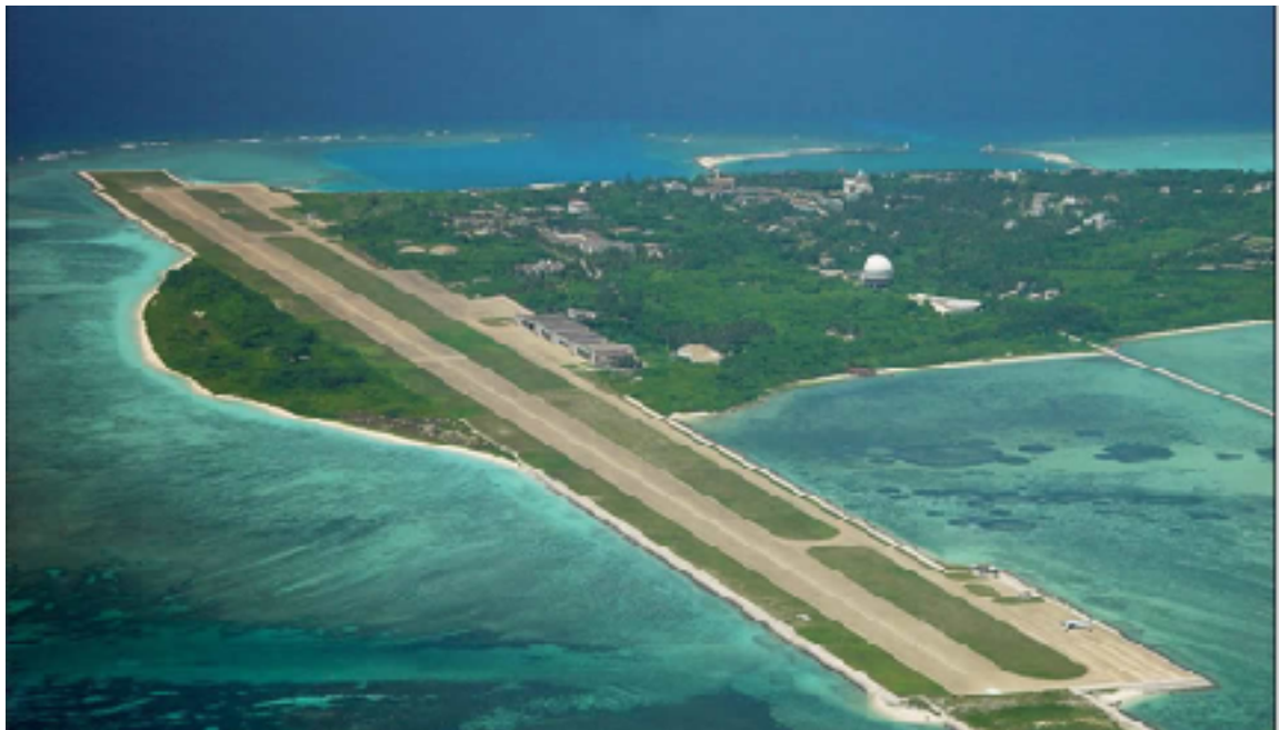
Ett av flera kinesiska flygfält i Sydkinesiska sjön

Bakgrund till Katedralskolans FN-rollspel 2018