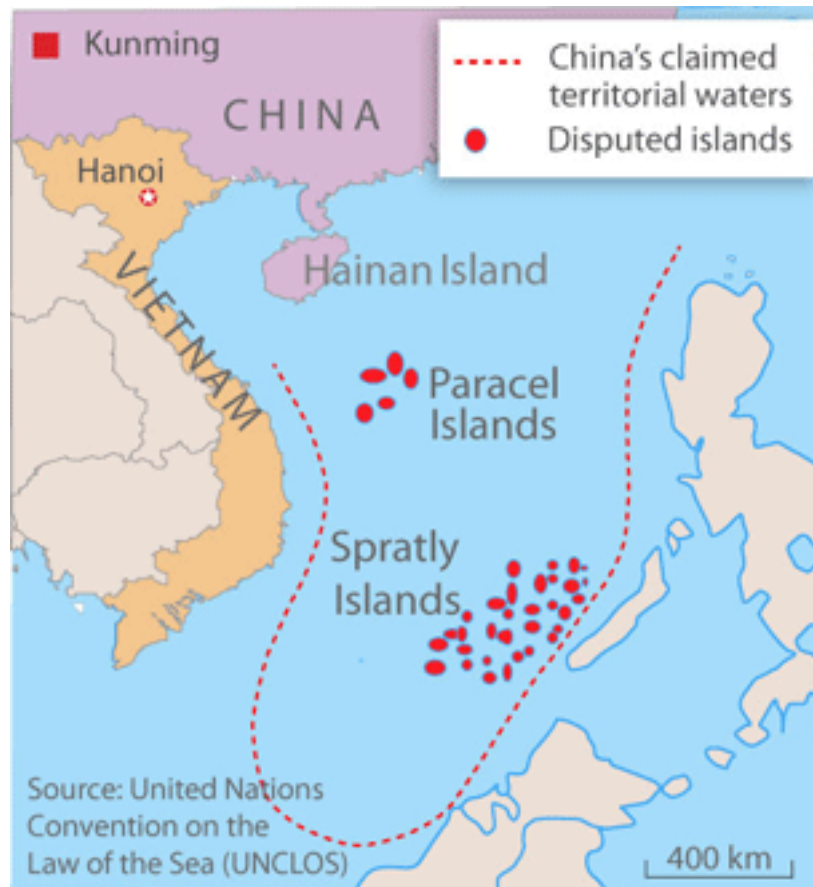
De kinesiska kraven på öarna