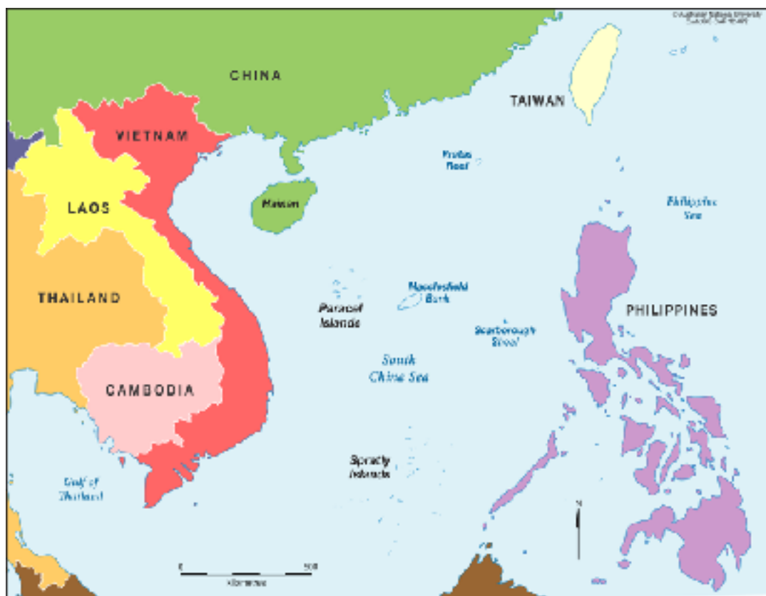
En karta över Sydkinesiska sjön

Spratly- och Paracelöarna är två ögrupper i Sydkinesiska sjön. De flesta av öarna är bara små kobbar där många hamnar under vattenytan vid högvatten. Öarna saknar i huvudsak möjlighet att försörja en bofast befolkning, däremot har länge funnits en halvbofast fiskarbefolkning.