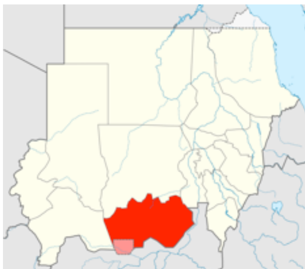
Södra Kordofan med provinsen Abyei markerad

hamnar vid havet. I nuläget finns bara ledningar till hamnar i Sudan. Orsaken till att Sudan stängde av oljeledningarna från Sydsudan var oenighet om hur mycket av oljeintäkterna som ska tillfalla Sudan och hur mycket som ska tillfalla Sydsudan. Eftersom Sydsudan är starkt