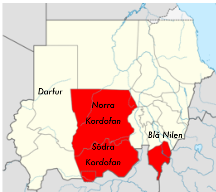
Områden som berörts av konflikten i Södra Sudan

Kordofan (The Heglig Crisis). Även om oljan finns i Sydsudan måste den transporteras till