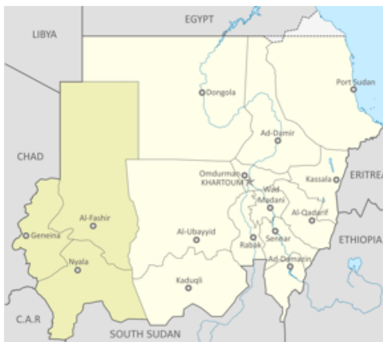
Det markerade området är provinsen Darfur

Södra Sudan blev slutligen en självständig stat 2011.