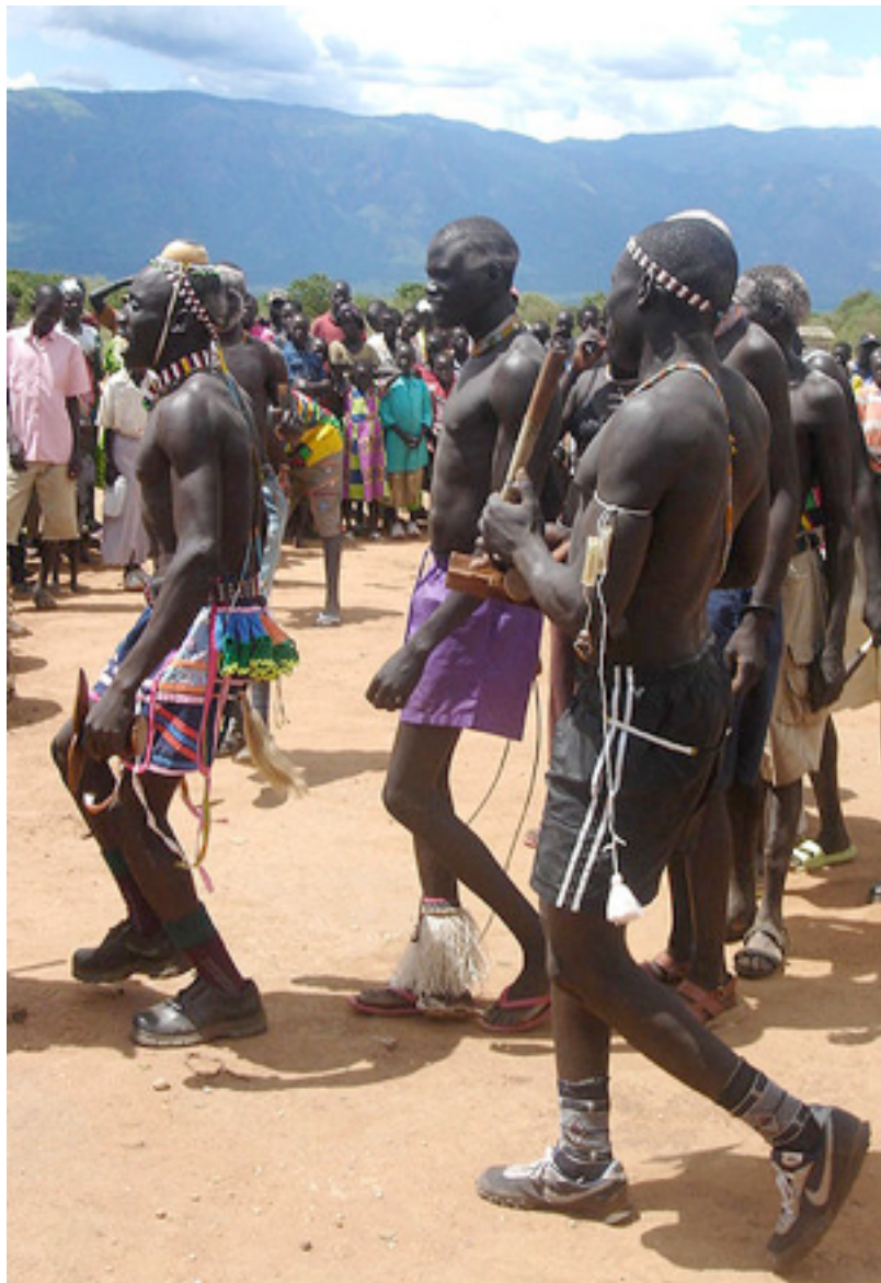
Invånare i Sydsudan dansar för att fira fredsavtalet med Sudan

Bakgrund till Katedralskolans FN-rollspel 2014