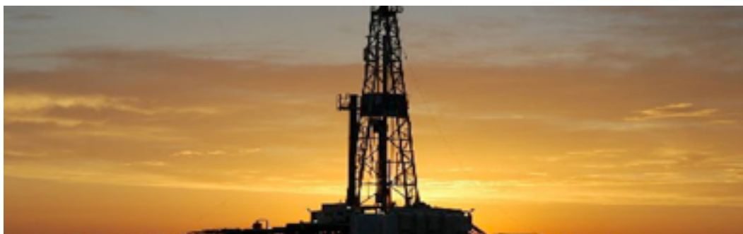
En oljekälla i Sydsudan

Enligt vissa rapporter har Kina erbjudit sig att ge lån till Sydsudan tills man har byggt oljeledningar via Kenya och man har fått till stånd ett exportavtal med Kenya, men mycket talar för ett fortsatt beroende av Sudan. Men om det skulle bli möjligt att exportera via Kenya skulle USA och amerikanska oljebolag kunna bli handelspartners. För närvarande bedriver dock Sydsudan lobbyverksamhet för att lätta på handelsrestriktioner för amerikanska bolag som gör affärer med Sudan.