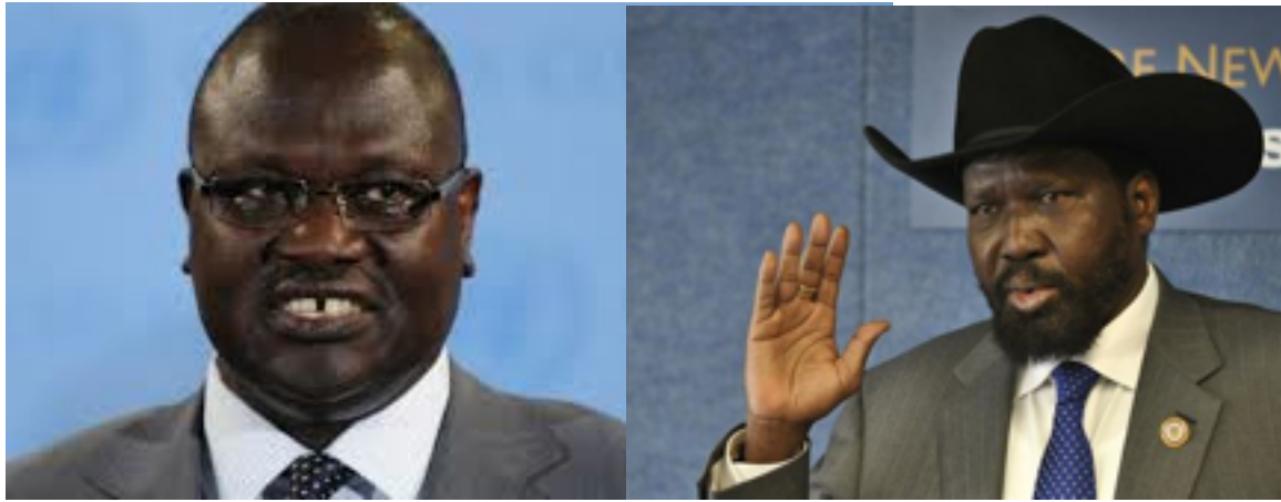
Före detta vicepresidenten Riek Machar och president Salva Kiir i karakteristisk stetsonhatt.

President Kiir tillhör Sydsudans största befolkningsgrupp, Dinka, medan Machar tillhör en annan av de större befolkningsgrupperna: Nuer. Konflikten mellan Kiir och Machar utvecklades snart till till lokala strider där hela folkgrupperna Dinka och Nuer sögs in. Inom veckor hade tusentals människor dött och drygt 800.000 flydde från sina hem. Oljeproduktionen föll också drastiskt.